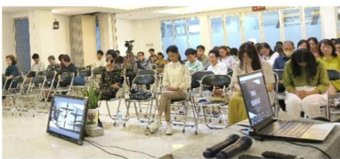
Peralatan Multimedia yang masih harus ditambah

Untuk dukungan dalam bentuk dana, bisa disampaikan ke rekening gereja dengan kode akhiran 03 (contoh : Rp. 100.003) atau persembahan khusus melalui amplop (berikan kode P3I) dan masukkan ke kantong persembahan.