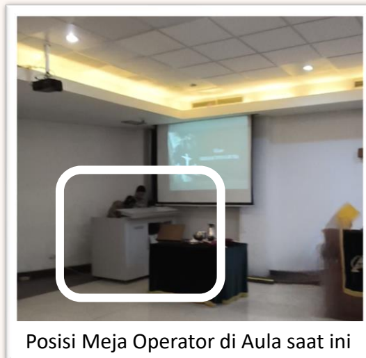
Posisi Meja Operator di Aula saat ini

Namun, untuk mewujudkan kedua hal di atas, diperlukan anggaran tambahan di luar dana operasional yang tersedia. Kami mengundang jemaat untuk bersama-sama mendukung program ini melalui doa, semangat kebersamaan, dan partisipasi nyata, agar pelayanan Gereja kita dapat terus berkembang dan menjadi berkat bagi banyak orang.